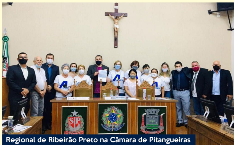
Regional de Ribeirão Preto na Câmara de Pitangueiras

Aposentados de todo o Estado estão mobilizados e também pressionam pela aprovação de projetos de lei | pág. 03