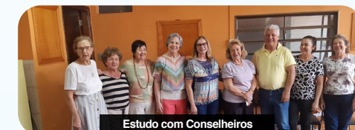
Estudo com Conselheiros