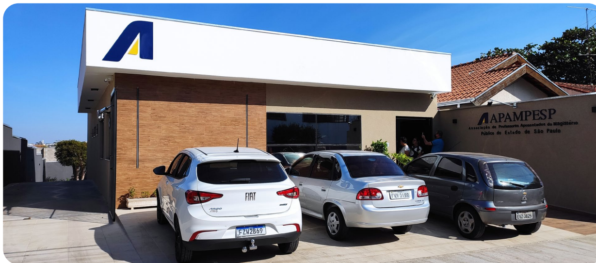
Nova Regional de Bauru conta com estacionamento amplo, auditório, salas de atendimento e acessibilidade

O fortalecimento da Apampesp enquanto Entidade tem ido além do âmbito político. Depois de ultrapassar as fronteiras do Estado com a luta pela permanência do professor aposentado no Fundeb, ganhando destaque em todo o Brasil, a Entidade também faz o dever de casa ao cumprir o compromisso de preservar o patrimônio da Associação. Somente no período de junho a agosto deste ano, a gestão Unir, Renovar & Crescer entregou três Sedes Regionais, sendo uma reforma e duas construídas do zero, com o objetivo de melhorar a estrutura de trabalho e de oferecer um atendimento mais completo aos associados.