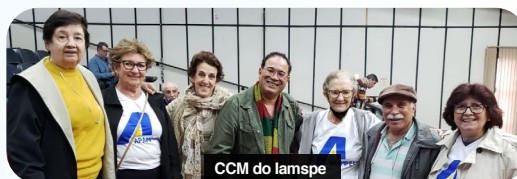
CCM do Iamspe