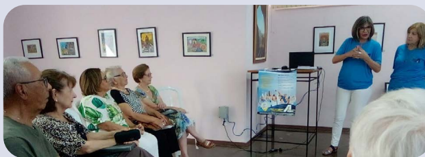
Reunião com associados de Mogi Mirim e de Mogi Guaçu organizada pela Regional de Socorro no dia 10 de setembro