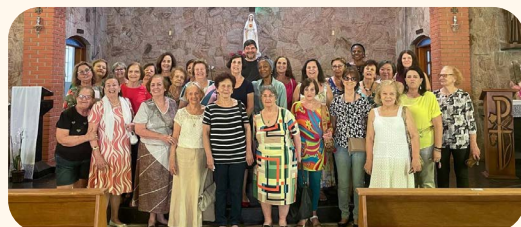
Missa em Ação de Graças pelo Dia do Professor