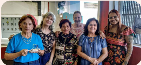
Comemoração pelo Dia dos Pais em Presidente Prudente