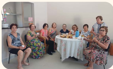
Reunião da turma do tricô, na regional de Marília, no dia 14 de junho