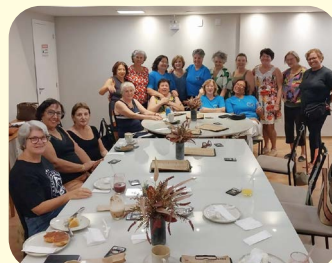
No dia 7 de agosto, a Regional de Araraquara promoveu um Café da Tarde com associados na Bella Fonte Cafeteria. O encontro também contou com a presença do jornalista José Carlos Magdalena, do jornal Portal Morada, referência na região. Ele fez questão de conversar com as Representantes da Apampesp e, no dia seguinte, deu destaque ao trabalho da Entidade durante o seu programa ao vivo.