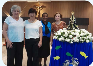
Missa em Ação de Graças pelo Dia do Professor