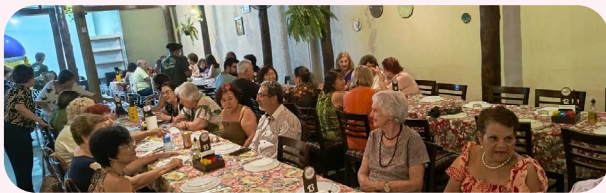
A Regional de Fernandópolis celebrou o Dia do Professor e o aniversário de 30 anos da Apampesp com uma confraternização realizada no dia 16 de outubro