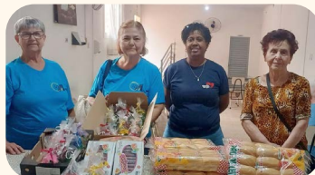
No dia 8 de agosto, café da tarde na Casa do Caminho para homenagear os pais e presentear-los