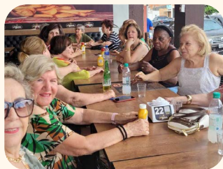
Dia do Professor celebrado em 15 de outubro