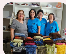
Associadas da Regional de Lins produziram cachecóis e entregaram, no dia 3 de julho, ao Grupo do Câncer.