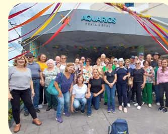
Excursão realizada entre os dias 15 e 22 de junho com associados de Araraquara e região para a cidade de Aracaju