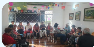
Arraia na Sede Regional de Mogi das Cruzes. Comemoração realizada no dia 24 de junho