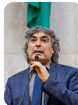
Deputado estadual Carlos Giannazi