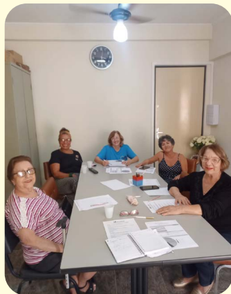
No dia 26 de julho, a Regional de Araraquara promoveu um dia de reunião com Dirigentes e membros do Conselho Deliberativo. Na pauta, a organização de novos eventos, lutas e projetos para o segundo semestre.