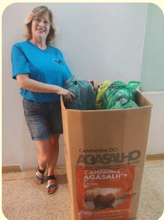
Entrega da segunda caixa de coleta da Campanha do Agasalho em Parceria com a Apampesp