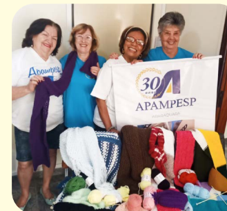
No dia 12 de julho foram entregues os cachecóis feitos na tarde de Café, Bate-Papo e Tricô ao Asilo Lar São Francisco de Assis.