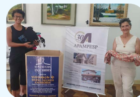
No dia 12 de setembro, o Grupo de Apoio às Pessoas com Câncer (GAPC) retirou as caixas com doações feitas pelos associados da Apampesp, na Regional de Mogi das Cruzes. Foram doados roupas, sapatos e acessórios para a instituição.