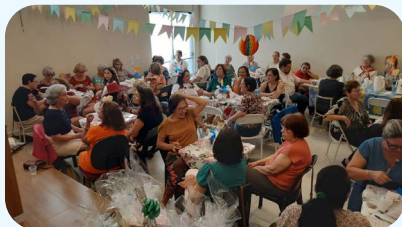
Arraia da Apampesp em Bauru. Comemoração realizada no dia 20 de junho