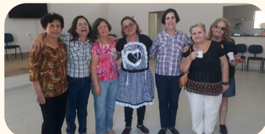
Festa junina na Regional de Marília