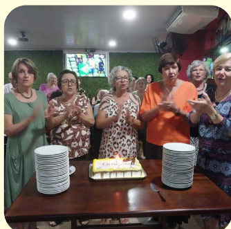
Jantar realizado no dia 12 de novembro em comemoração aos aniversariantes do mês de novembro, ao Dia do Diretor de Escola e em referência ao Novembro Azul.