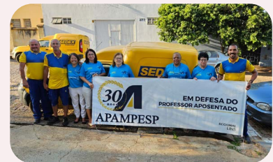
No dia 25 de junho, os Correios estiveram presentes na Regional de Lins para efetuar a retirada de 360 litros de leite doados por associados da Apampesp, destinados aos afetados pelas enchentes no Rio Grande do Sul.