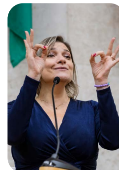
Deputada federal Luciene Cavalcante