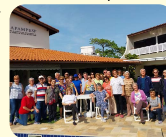
Excursão para a Sede Recreativa de Itanhaém realizada de 10 a 15 de outubro