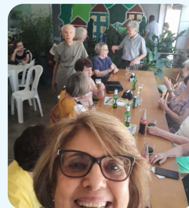
Dia do Professor e 30 Anos da Apampesp em Americana. Comemoração organizada pela Regional de Campinas