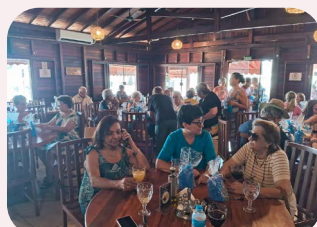
Almoço pelo Dia do Professor realizado no restaurante Casa do Tom