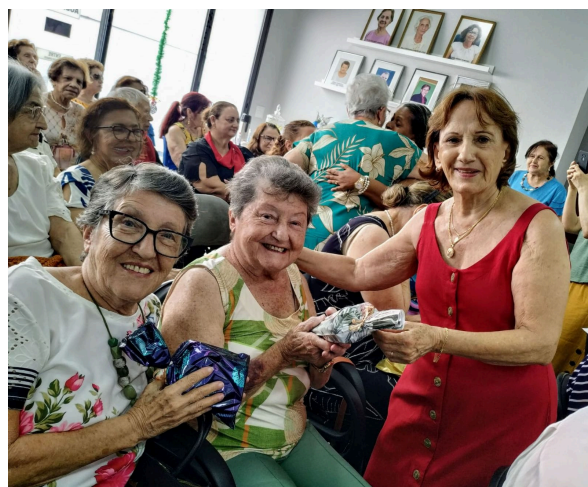
Confraternização de Final de Ano 2024 com Homenagens a Associados.

“Façamos o nosso melhor. Afinal nenhum de nós é tão bom quanto nós todos juntos