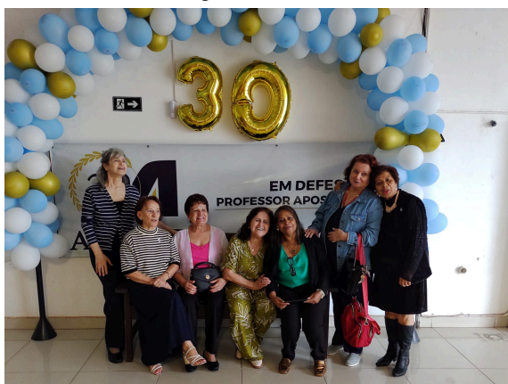
Almoço de Confraternização Dia do Professor.