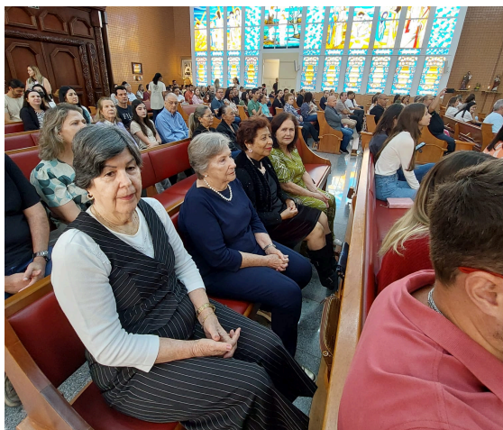
Missa em Homenagem ao dia do Professor.